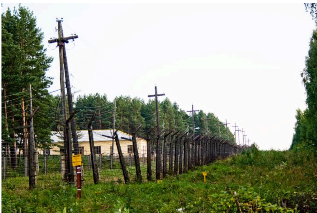
Забор из колючей проволоки на «границе» закрытого города Озерска, 2007 год