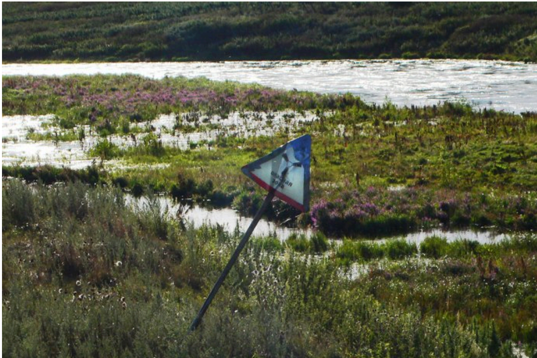
Знак радиоактивной опасности у реки Теча, 2007 год

беременности. Но такой категории [пострадавших] нет в законе, поэтому ей ничего не положено. И вот эта женщина рыдает: „Меня дочь проклиняет: „Зачем ты такую уродину родила?“ На меня это произвело неизгладимое впечатление. Мы взялись их защищать, но, к сожалению, обе они очень быстро друг за дружкой умерли».