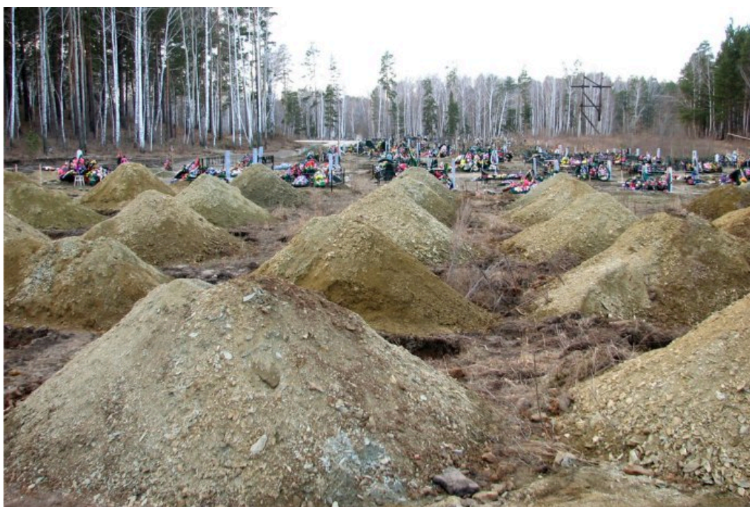
Кладбище «Березовая роща» в Озерске, 2007 год

Несмотря на социальное благополучие Озерска, смертность в нем значительно превышает рождаемость. Так, за 2023 год местный ЗАГС зарегистрировал 454 новорожденных и 1068 умерших. В январе этого года в закрытом городе родилось 28 человек, умерло 126; в феврале — 25 и 79; в марте — 25 и 99 человек соответственно.