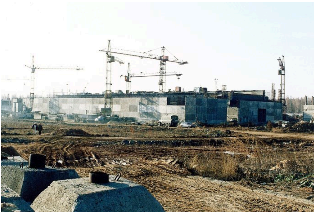
Строительство хранилища контейнеров с радиоактивными материалами на территории «Маяка»

В ноябре Росгидромет признал , что с 25 сентября все посты на Южном Урале регистрировали превышение радиационного фона — причем в селе рядом с Озерском загрязнение повысилось почти в тысячу раз по сравнению с августом.