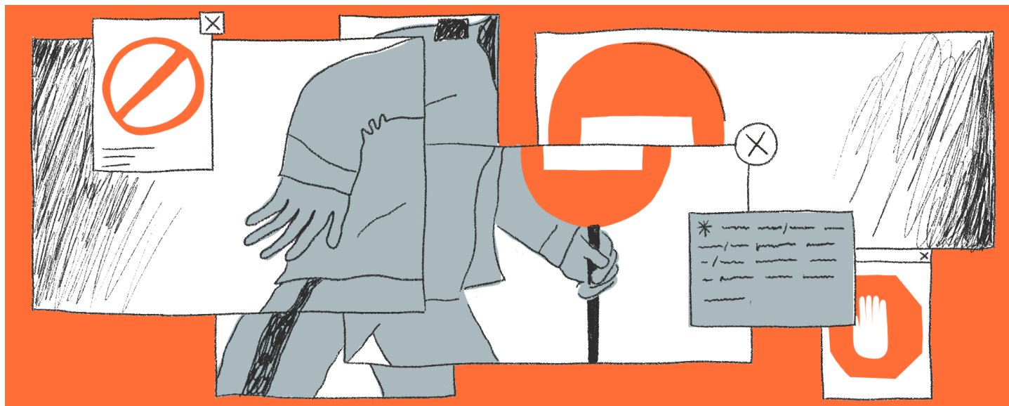
Иллюстрация: Катя Симачева для ОВД-Инфо