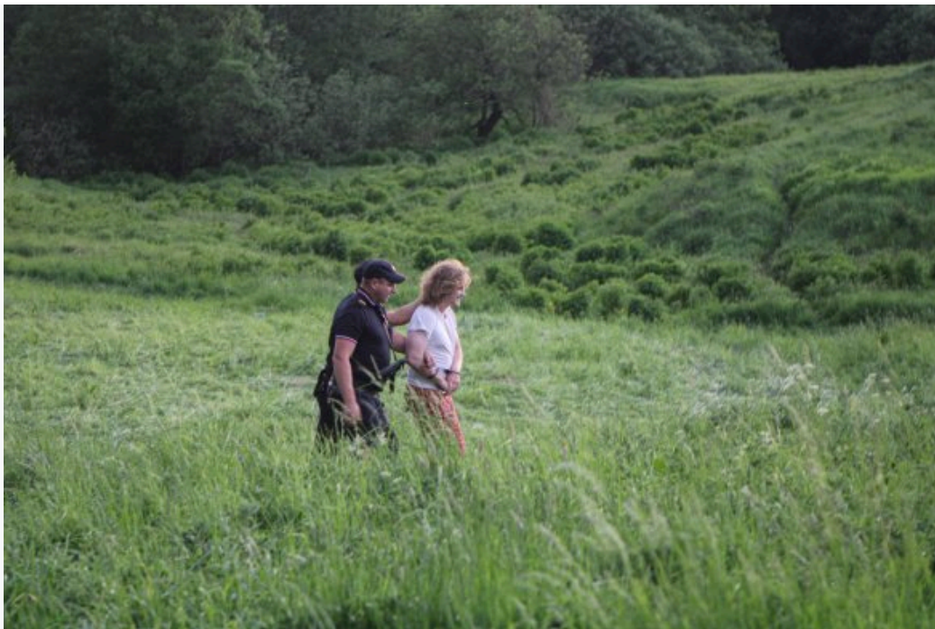
Задержание участников «Хиппятника» в парке Царицыно, 1 июня 2024 год

«Несколько людей в форме там и так „дежурили“, конная полиция своим присутствием еще больше напугала народ, — говорит Олег. — На входе я видел автозаки. Там же стояли и полицейские, которые не разрешали никому входить в парк, только выходить позволяли. А те, что на конях, начали требовать покинуть поляну под тем предлогом, что „Хиппятник“ — это несогласованная акция. Но как это может быть несогласованной акцией, если у мероприятия даже нет никакой четкой программы? Люди приходят из года в год, потому что это традиция. Никакой охраны, ЧОПа в парке я не видел. Администрация помогать людям тоже не спешила».