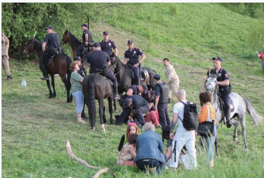
Задержание участников «Хиппятника» в парке Царицыно, 1 июня 2024 год